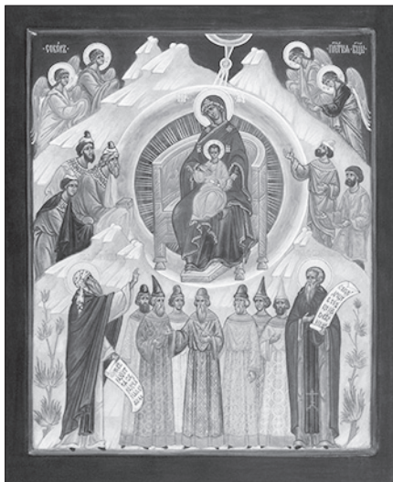
Собор Пресвятой Богородицы. Современная икона.

На другой день после Рождества Христова Церковь прославляет Пресвятую Богородицу. В Ней сосредоточены все добродетели: девственная чистота и целомудрие, преданность воле Божией, стойкость среди величайших скорбей, материнская заботливость и сердечная красота, смирение и любовь к Богу и людям. Праздник называется Собором Пресвятой Богородицы, так как в этот день верующие собираются в храмах для почитания Божией Матери в молитвах и славословиях.